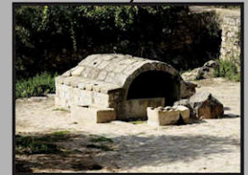
Pozabajo (fuente romana)