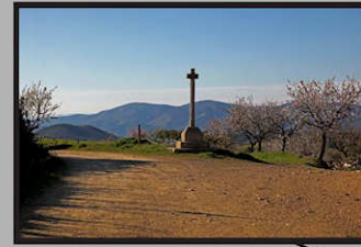
Cruz de Canto