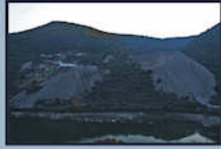
Mina de Alabancos