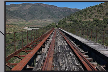
Ponte de las Almas